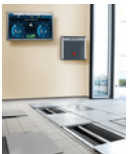
Pkw-Bremsenprüfstand BD 4482 Artikelnummer: 1 691 600 888