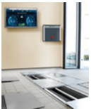
Pkw-Bremsenprüfstand BD 4182 Artikelnummer: 1 691 600 670