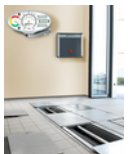
Pkw-Bremsenprüfstand BD 4332 Artikelnummer: 1 691 600 648