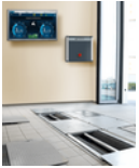
Pkw-Bremsenprüfstand BD 4132 Artikelnummer: 1 691 600 642